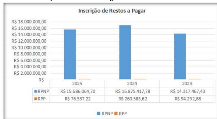
Gráfico 06: Inscrição de Restos a Pagar de exercício anterior e anteriores