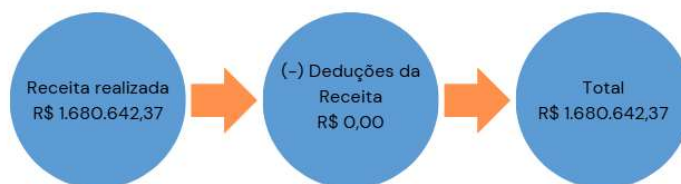
Figura 02: Composição da Receita Orçamentária