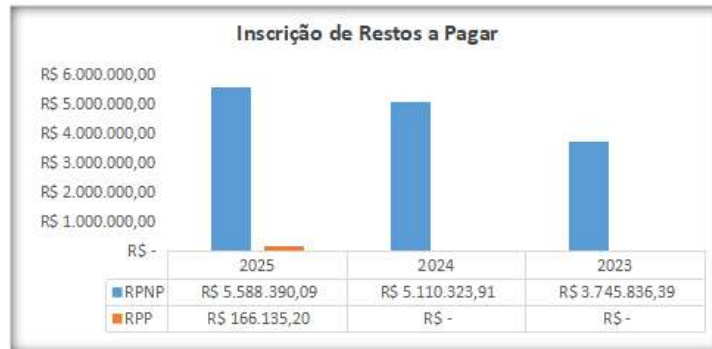
Gráfico 5: Inscrição de Restos a Pagar