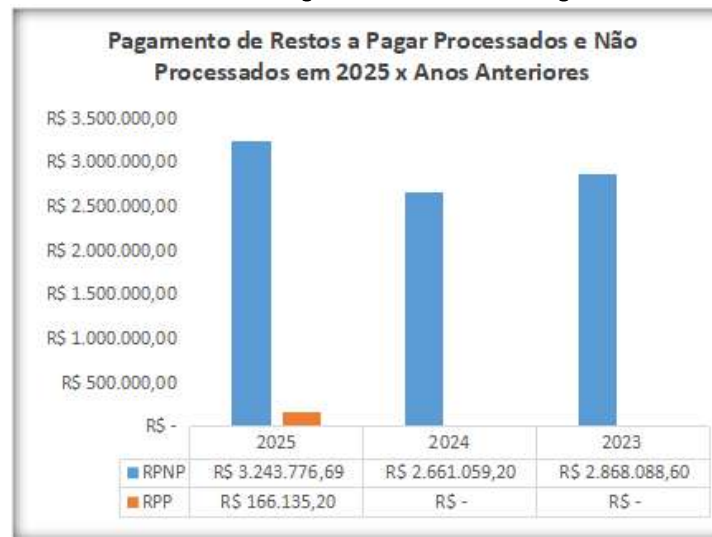
Gráfico 06 - Pagamento de Restos a Pagar