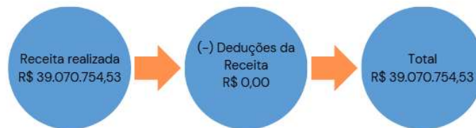
Figura 03: Composição da Receita Orçamentária