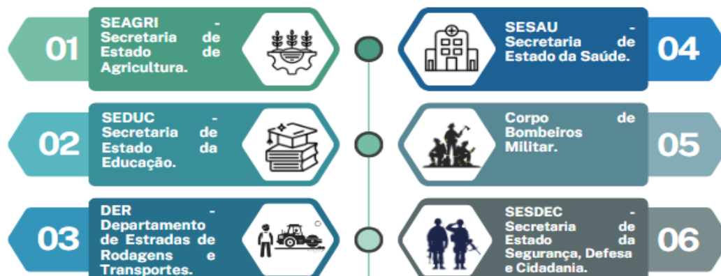
Figura 2: Unidades Gestoras aderidas